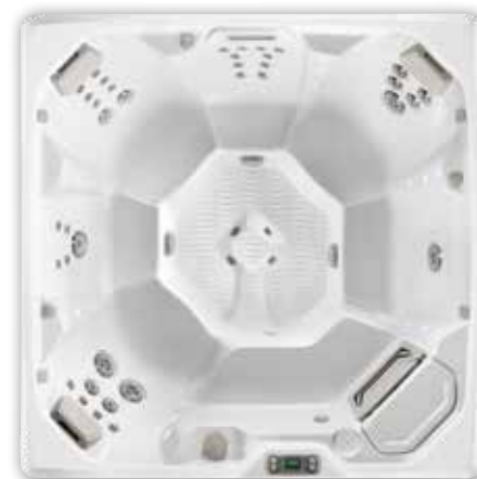
Flash™ - 7 personnes