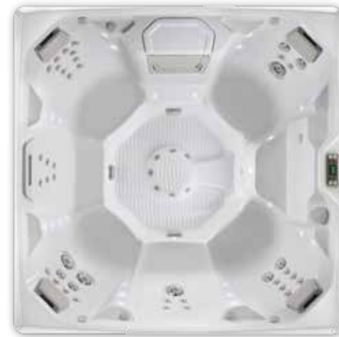
Pulse™ - 7 personnes