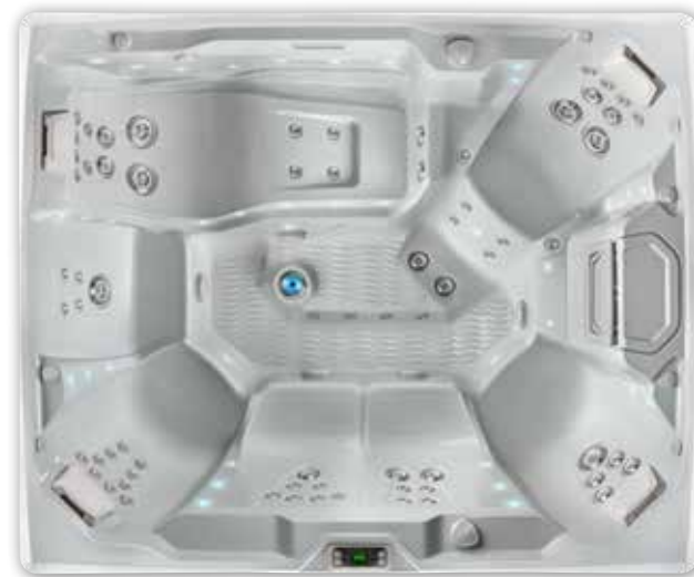
Prism™ - 7 personnes