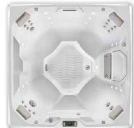
Beam™ - 4 personnes