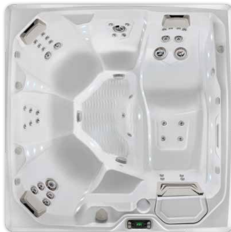
Coque Flair en Blanc alpin.

Voir les spécifications détaillées pour le modèle Flair à la page 36.