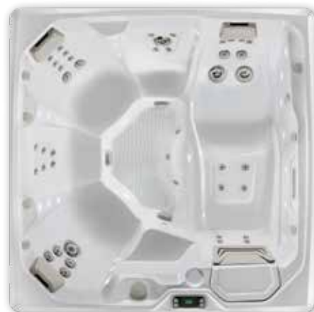
Flair™ - 6 personnes