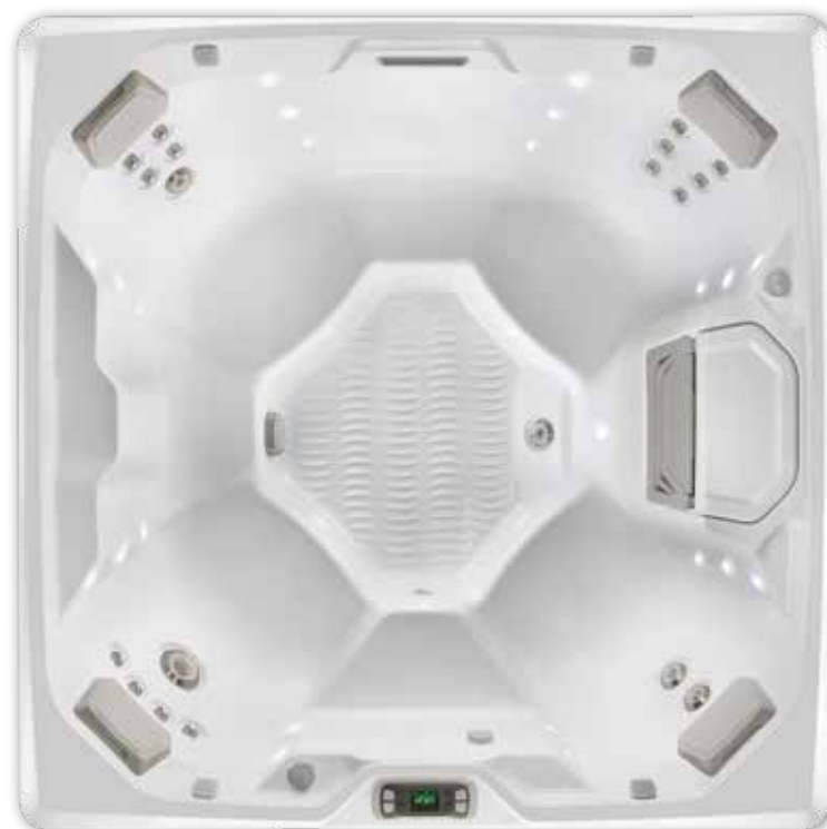
Beam avec Coque en Blanc alpin.

Voir les spécifications détaillées pour le modèle Beam à la page 36.