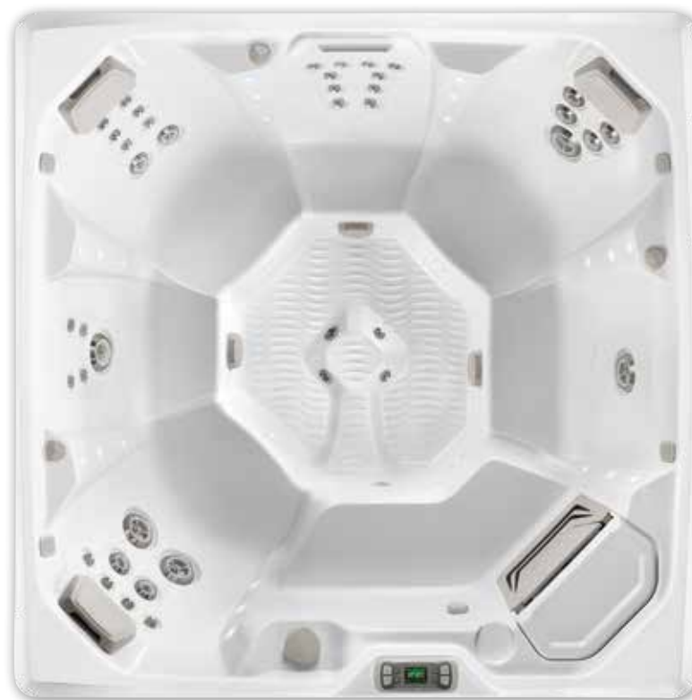
Flash avec Coque en Blanc alpin.

Voir les spécifications détaillées pour le modèle Flash à la page 36.