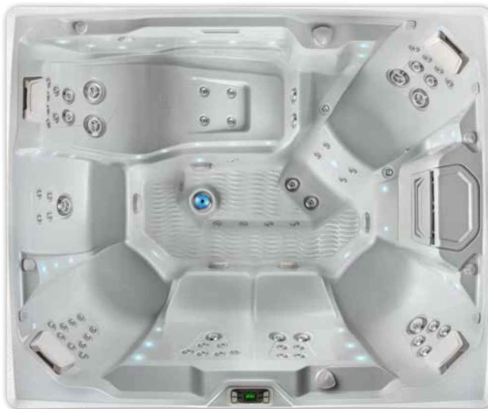
Coque Prism avec coque Gris glacé.

Voir les spécifications détaillées pour le modèle Prism à la page 36.